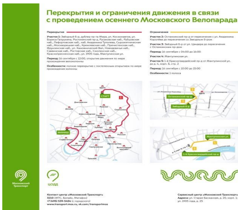
Рисунок 1. Маршрут осеннего Московского Велопарада и схема перекрытий/ограничений движения 1