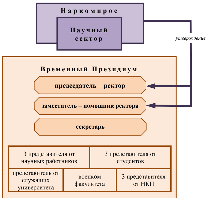
Рис. № 2. Схема управления МГУ в 1920–1921 гг.

ответственность перед Наркомпросом за правильное течение всей жизни университета. Весь персонал университета подчинялся распоряжениям ректора 25 .