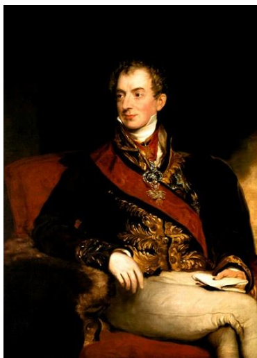
Клеменс фон Меттерних

Приверженность к стабильности вызывала симпатии и понимание у партнеров по переговорам. Даже солидная внешность Меттерниха придавала ему высокое