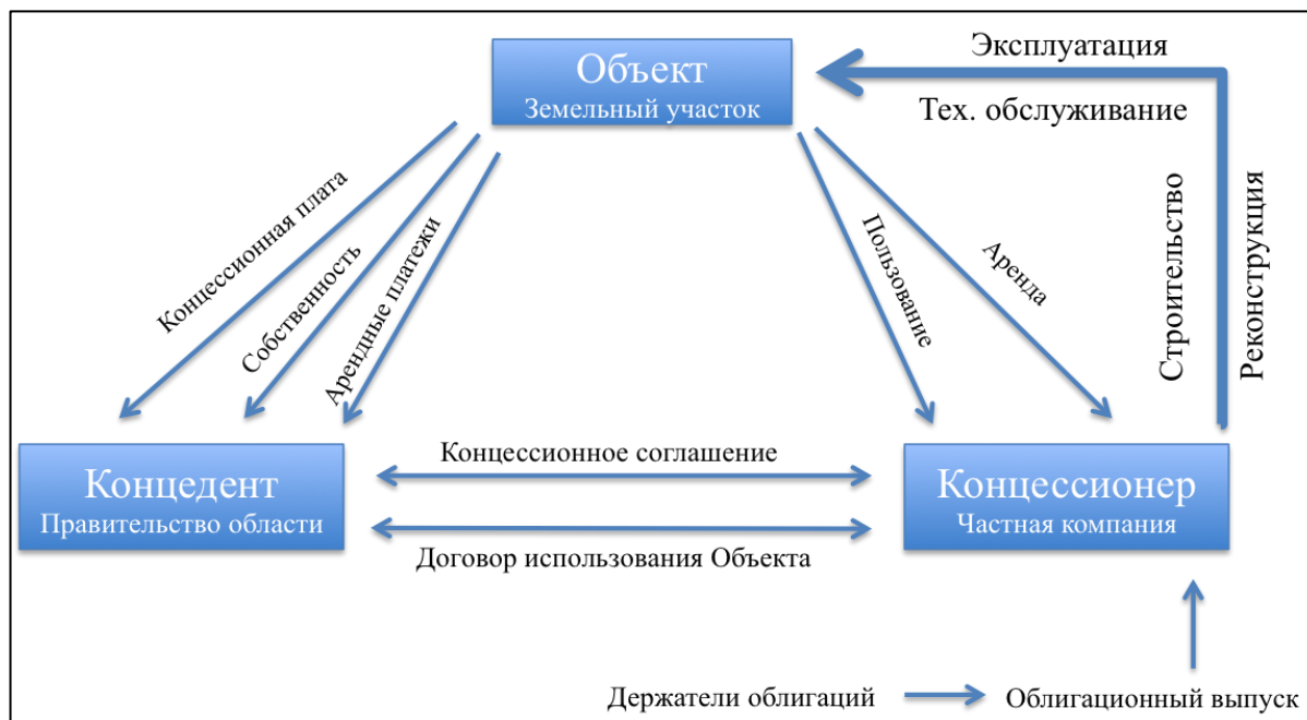
Рисунок 2. Процесс реализации проекта по строительству спортивного комплекса 22

Схема перераспределения платежей во многом схожа с примером, описанным выше, и представлена на Рисунке 2. Принципиальное отличие заключается в том, что в этом проекте частный партнер использует заемные средства путем выпуска облигаций.