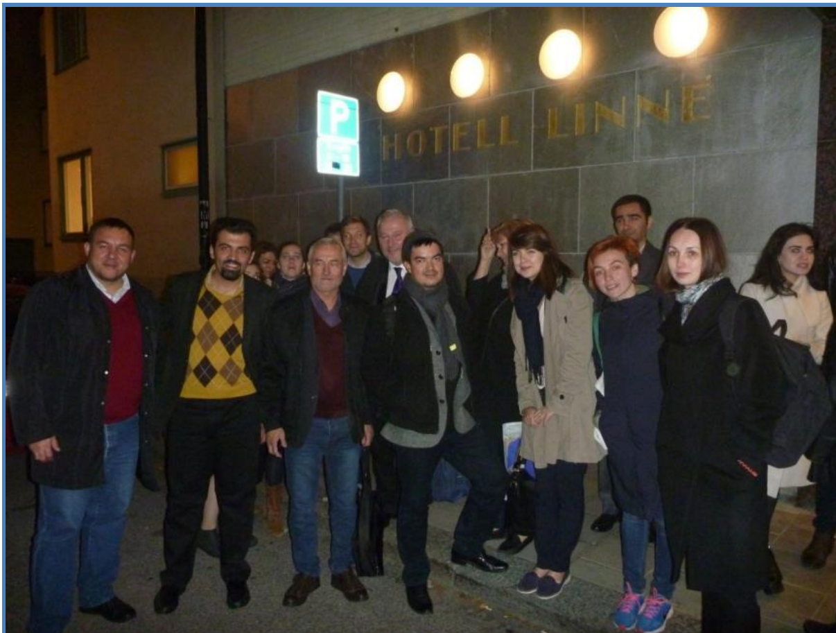
На фото: участники конференции