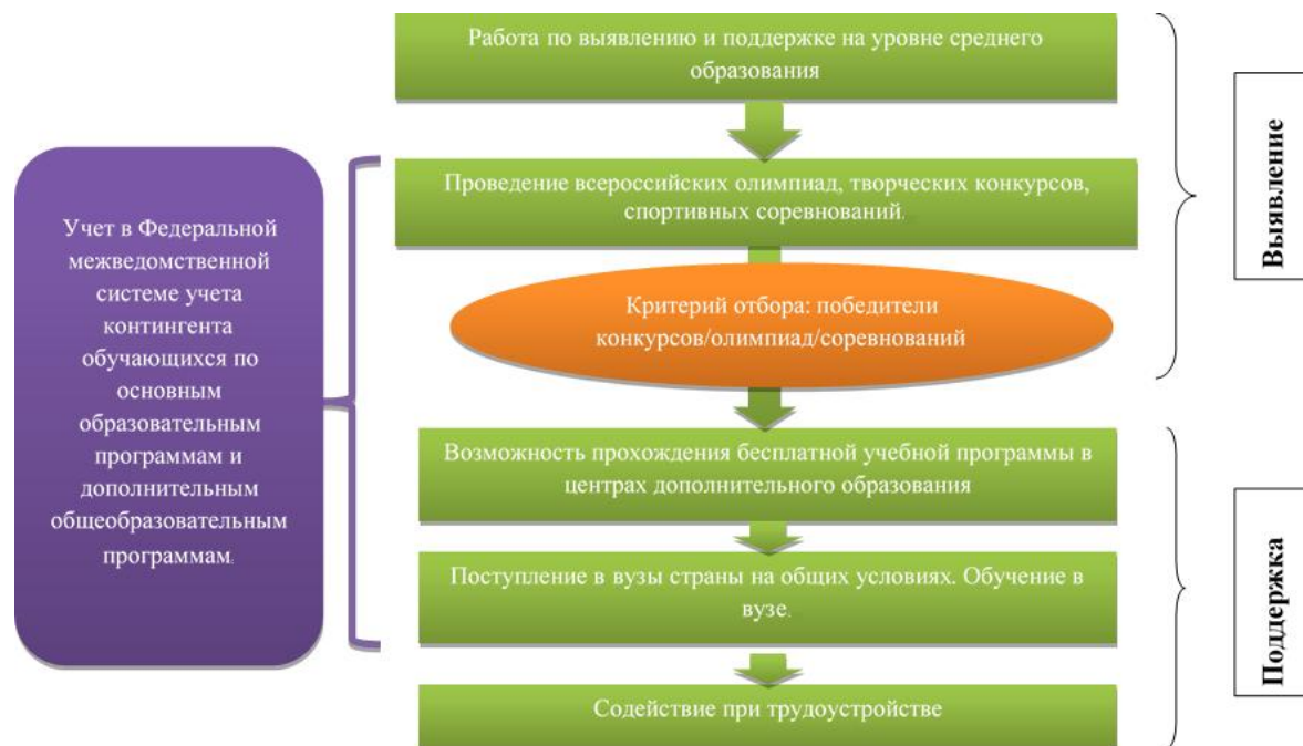
Рисунок 4. Модель выявления и поддержки одаренной и талантливой молодежи на современном этапе 23

Более формализованное представление происходящих процессов в Системе выражено в модели процесса выявления и поддержки одаренной и талантливой молодежи на современном этапе на рисунке 4.