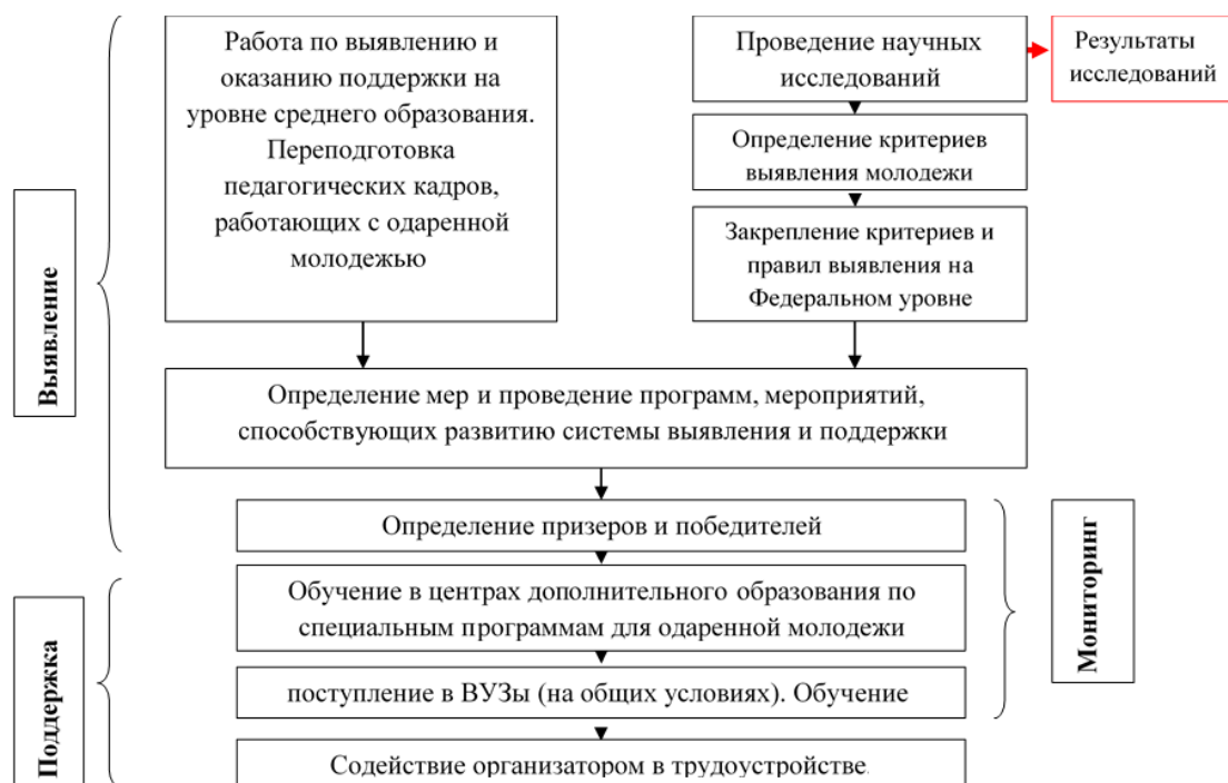
Рисунок 3. Система выявления и поддержки на современном этапе в России 22

Совокупность процессов выявления и поддержки одаренной молодежи отражена на рисунке 3.