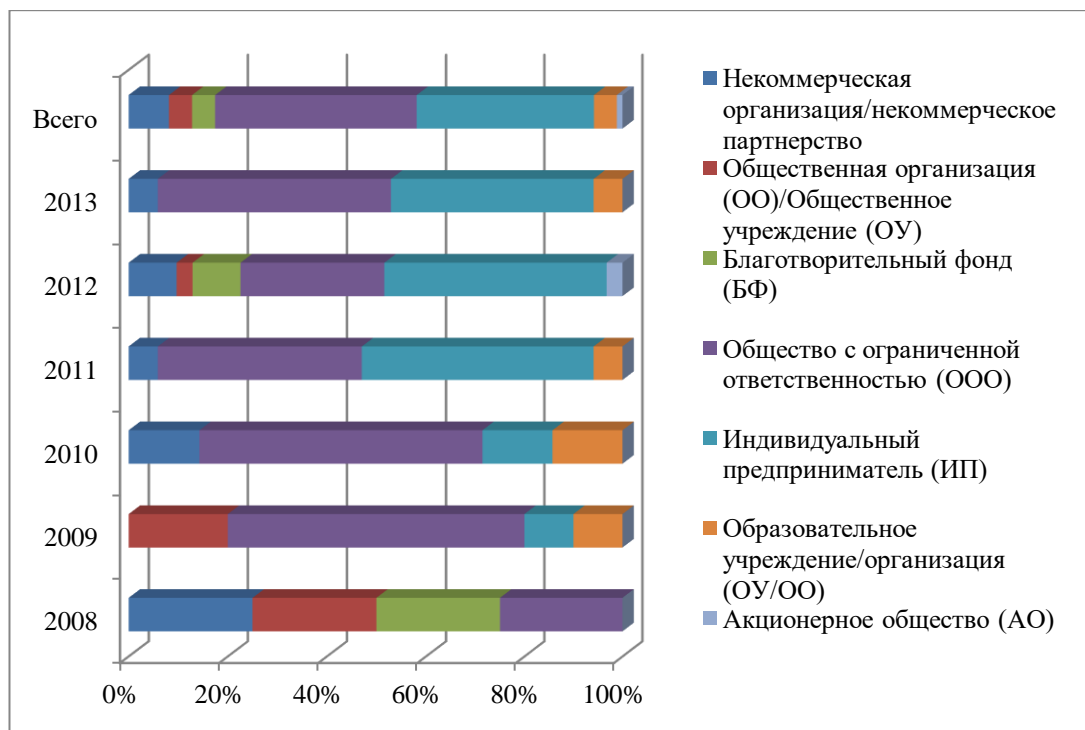
Рисунок 2. Распределение поддержанных проектов по организационно-правовым формам 7

(фермерские) хозяйства (35%), еще 17% ведут свою деятельность как НКО и общественные организации (13%). Более подробное распределение представлено на Рисунке 2.